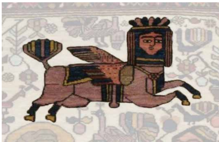
تصویر ۵: فیگور جانوری ماورای طبیعی بخش بالایی تصویر قالیچه (نگارندگان).

در این تصویر، هفت پرنده وجود دارند که دم و تاجی مانند طاووس و خروس دارند، اما به‌طور کلی نمی‌توان مابه‌ازای طبیعی برای آن‌ها متصور شد. یکی از این پرنده‌ها در کنار فیگور انسانی مخاطب بخش میانی قرار دارد. علاوه بر این‌ها موجود دیگری در تصویر دیده می‌شود که سر انسان، بدن چهارپا که با توجه به نحوه تاختن و زینش، احتمالاً بدن اسب، بال پرنده و دمی مانند دم طاووس دارد. بنا بر آنچه در تصویر دیده می‌شود، این موجود هیچ مابه‌ازای طبیعی ندارد. محل قرارگیری این موجود نیز از محل قرارگیری فیگورهای انسانی جدا شده و با توجه به غیرطبیعی بودن ظاهر آن چنین به نظر می‌رسد که بخش بالایی تصویر این قالیچه به یک عالم فراطبیعی اشاره می‌کند که موجودات فراطبیعی در آن زیست می‌کنند (تصویر ۵).