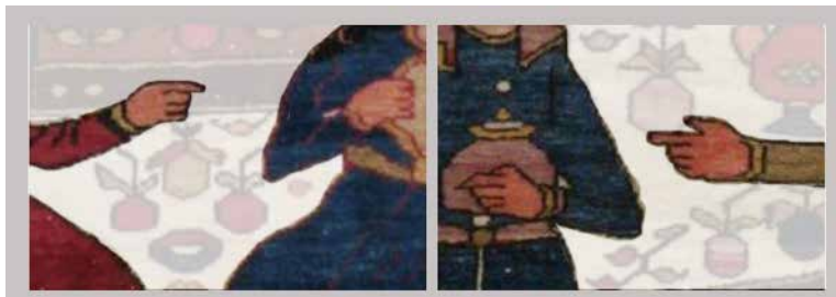
تصویر ۴: اشاره به فیگور آبی‌پوش از سوی سایرین در دو بخش میانی و پایینی تصویر قالیچه (نگارندگان).

در این دو بخش، شخصی که لباس آبی‌رنگ به تن دارد، از سوی دیگران مورد خطاب یا توجه قرار گرفته است. در بخش پایینی، فرد خطاب‌کننده در سمت چپ او قرار دارد و در بخش میانی، مخاطب سمت راست او واقع شده است. با توجه به کنش مشابهی که در هر دو بخش در مورد فرد با لباس آبی صورت گرفته و با نظر به تفاوت سن فیگورهای کودکانه با بزرگسال میانه تصویر، به‌نوعی گذر زمان نیز به ذهن متبادر می‌شود (تصویر ۴).