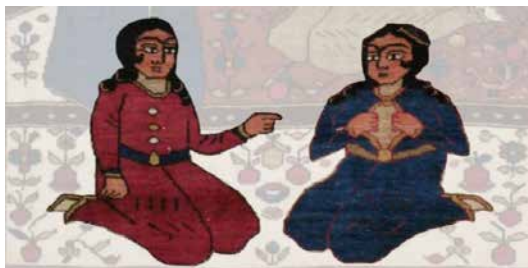
تصویر ۲: فیگورهای انسانی بخش پایینی تصویر قالیچه بختیاری هینه‌گان (نگارندگان).

در تصویر این قالیچه، چهار فیگور انسانی دیده می‌شود که دو فیگور جثه کوچک‌تر دارند و در پایین تصویر با لباس آبی و قرمز قرار دارند. فرد با لباس آبی، کلاه کوچکی به سر دارد و در حال گشودن بالاپوش خود است و فیگوری که لباس قرمز به تن دارد، در حال نگرستن و اشاره کردن به اوست (تصویر ۲).