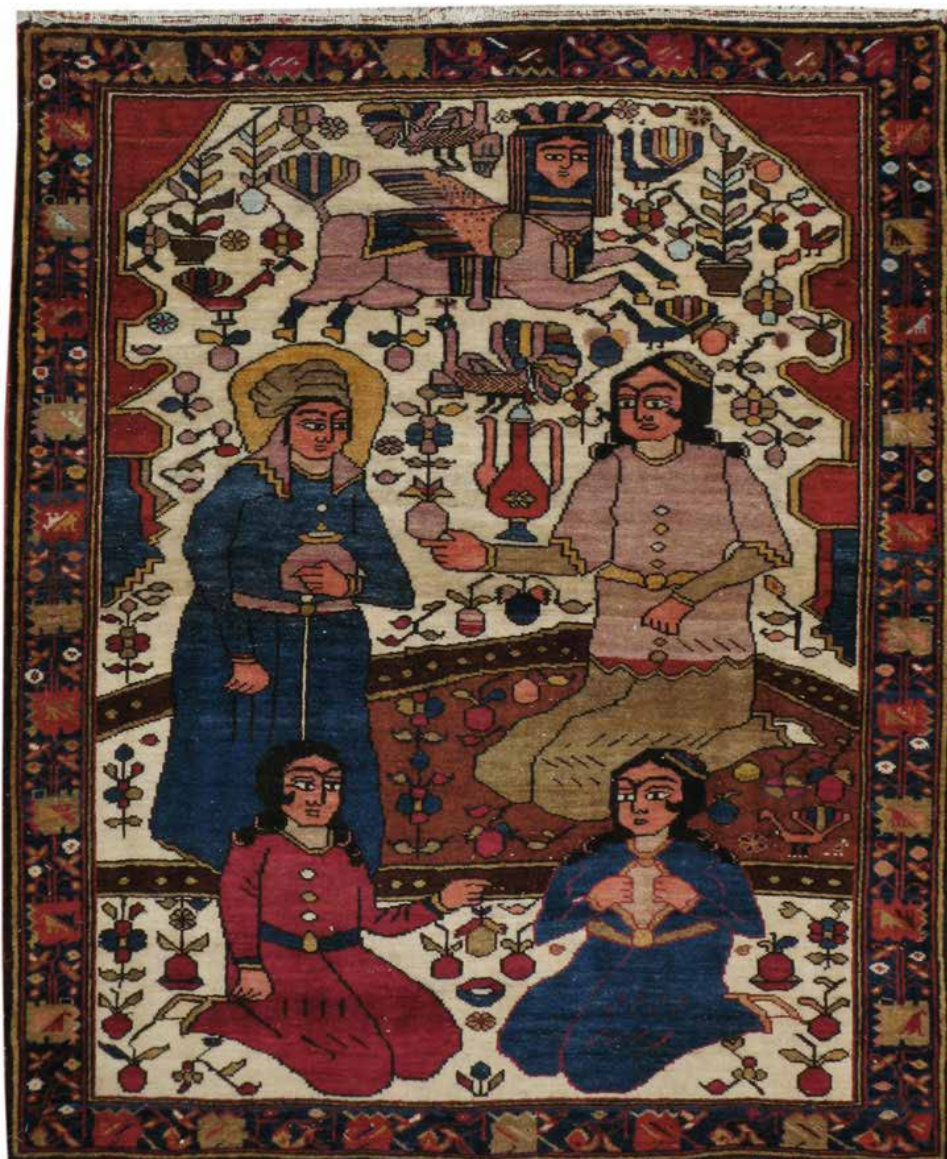
تصویر ۱: قالیچه تصویری هینه‌گان (galerieshabab.com).

و به‌عنوان یک روش تحقیق کیفی از سه مرحله تشکیل می‌شود که هریک از این مراحل در واقع در پی نیل به یکی از سه لایه معنایی است که پیش‌تر بدان پرداخته شد: توصیف پیش‌آینده‌نگاری ۲۰ برای فهم معنای ابتدایی یا طبیعی، تحلیل آیکنوگرافی ۲۱ برای فهم معنای ثانویه یا قراردادی، و آیکنولوژی ۲۲ برای فهم معنای ذاتی یا محتوایی و نمادین. نمونه مطالعاتی این پژوهش، یک تخته قالیچه تصویری بختیاری منطقه هینه‌گان به ابعاد ۱/۱۸ در ۱/۰۱ متر است که نام بخصوصی ندارد. درباره موضوع این قالیچه، نزد خوانندگان مختلف، آرای متفاوتی وجود دارد. در این بخش از پژوهش، مراتب به‌کارگیری آیکنولوژی در عمل و به‌منظور تشخیص موضوع تصویر این قالیچه و متعاقباً معنای آن تبیین می‌شود (تصویر ۱).