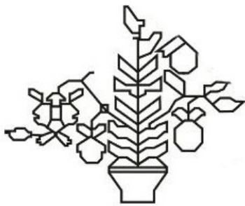
تصویر ۷: فیگور گیاهی هیبریدی (نگارندگان).

تقریباً همهٔ زمینهٔ تصویر این قالیچه با گیاهان مختلف طبیعی و غیرطبیعی پر شده است. در بخش پایینی قالیچه، پوشش گیاهی موجود شامل میوه‌هایی مانند سیب و گیاهان گل‌دار صحرایی است. در بخش میانی تصویر، گیاهان طبیعی و یک پرنده مانند پرندگان بخش بالایی تصویر، در زمینه دیده می‌شوند و در بخش بالایی آن شاهد انواع گیاهان گل‌دار و هیبریدی هستیم که ترکیبی از چند گیاه در یک فیگور هستند. سایر فیگورهای گیاهی این بخش نیز عمدتاً میوه و شبیه میوهٔ سیب هستند (تصویر ۶ و ۷).