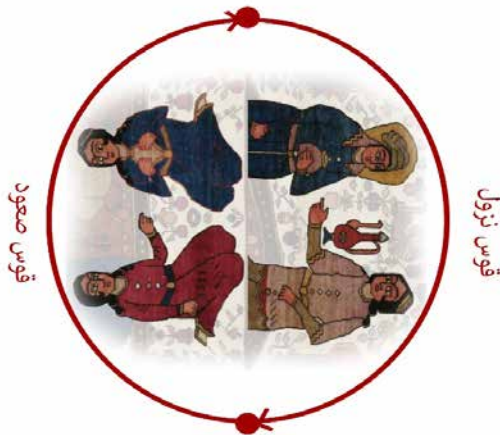
تصویر ۹: تعیین ضمنی قوس صعود و نزول در نقش‌مایه‌های قالیچه بختیاری هینه‌گان (نگارندگان)