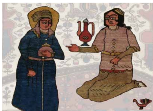
تصویر ۳: فیگورهای انسانی بخش میانی تصویر قالیچه بختیاری هینه‌گان (نگارندگان).

دو فیگور دیگر با جثه بزرگ‌تر و در قسمت میانی تصویر حضور دارند که یکی ایستاده با لباس آبی‌رنگ، ظرفی در دست دارد و هاله‌ای نورانی چهره‌اش را در برگرفته و دیگری، در حالت نشسته او را مورد خطاب قرار داده و در کنار دستش یک صراحی قرمز رنگ وجود دارد. با توجه به اندازه فیگورها در مقایسه با فیگورهای بخش پایینی تصویر، چنین به نظر می‌رسد که دو فیگور کوچک‌تر، فیگورهای کودکان هستند (تصویر ۳).