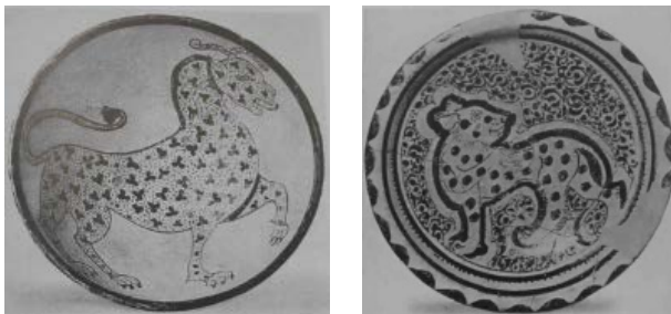
تصویر ۵: راست) شیر با خال‌های تیره روی بدن، زرین‌فام ری، قطر ۱۷/۸ سانتی‌متر (پوپ و اکرمین ۱۳۸۷، ج. ۹، ۶۳۱). چپ) شیر با خال‌های تیره، سفالینه زیرلعابی، سده ۳ یا ۴ هجری، قطر ۲۶/۳ سانتی‌متر (همان، ۵۸۲).

نقوش حیوانی مورد استفاده در این پارچه، به دو گروه حیوانات واقعی و اساطیری تقسیم می‌شوند. این حیوانات در میان انبوهی از گل‌ها و اسلیمی‌ها از چپ به راست در حال حرکت هستند. در این نقوش، گوزن، دو بز، یکی با شاخ‌های بلند و دیگری با شاخ‌هایی کوتاه‌تر و دو شیر که یکی از آن‌ها با حالتی درمانده و زبانی خارج از دهان، دم پایین انداخته، خستگی و تعقیب شکار را القاء می‌نماید، قابل مشاهده می‌باشند. وجود خال‌های سیاه روی بدن شیر، شباهت‌های آن و سفالینه‌های دوران سلجوقی (زیرلعابی، زرین‌فام و مینایی) و حتی دوره‌های قبل‌تر را یادآور می‌شود (تصویر ۵).