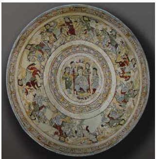
تصویر ۱۵: کاسه مینایی، قرن ششم و هفتم هجری (همان، ۱۶۹).

است، طبقه‌بندی این نمونه دشوار است اندیشه آن به وضوح ناشی از سبک یادماندنی ری است، اما حاشیه‌های تو در تو و ظریف آن به سبک مینیاتور تعلق دارد. افزون بر این اجزای حاشیه‌ها بیش‌تر به کاشان نزدیک است تاری، در حالی که تزئین شاخ و برگ به نظر می‌رسد قابل انتساب به ری باشد. امکان دارد ترکیب این خصوصیات نشان‌دهنده کارگاه‌های التقاطی ساوه باشد» (پوپ و اکرمین ۱۳۸۷، ج. ۴، ۱۷۹۱).