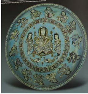
تصویر ۱۴: کاسه مینایی، قرن ششم و هفتم هجری (Eravşar & Karpuz 2014, (V.1, 142).