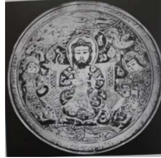
تصویر ۱۲: کاسه، سلطان‌آباد، ۶۲۴ ه.ق، زرین فام رنگارنگ، موزه ویکتوریا و آلبرت، قطر ۲۰ سانتی‌متر (پوپ و اکرمین ۱۳۸۷، ج. ۴، ۷۷۳).