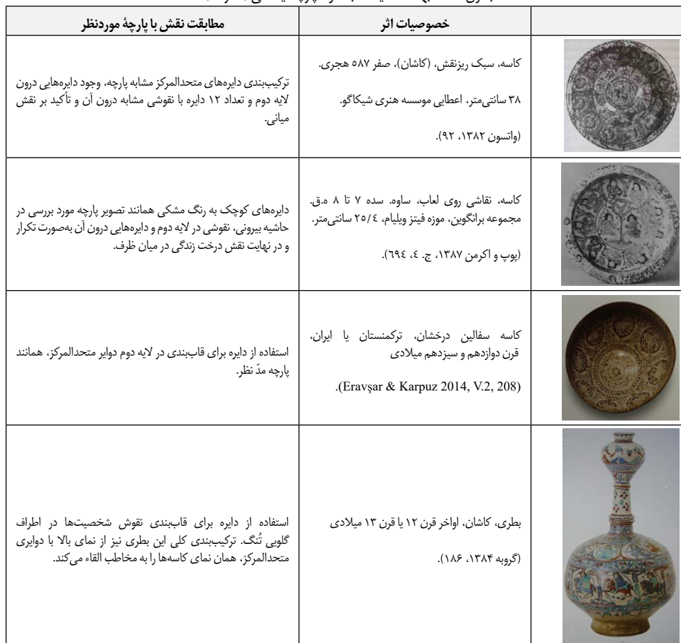
جدول ۲. مشابهت سفالینه‌ها با نمونه پارچه ایلخانی (نگارنده).