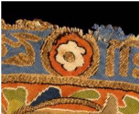
تصویر ۴: نقش گل شش‌پر در حاشیه بیرونی پارچه (نگارنده).