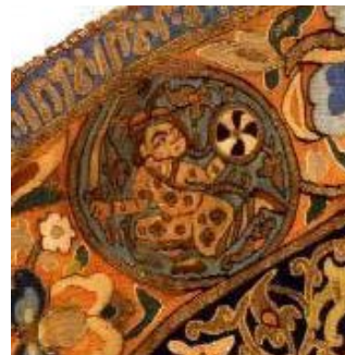
تصویر ۱۶: قسمتی از پارچه، نقش سرباز (نگارنده).