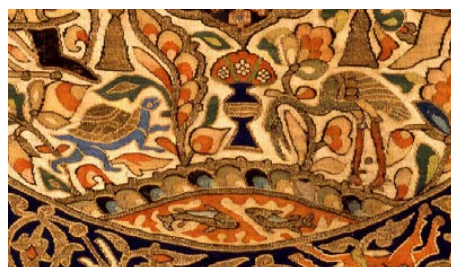
تصویر ۹: قسمتی از نقش پارچه. نقش لاکپشت و درنا و برکه‌ای با دو ماهی (نگارنده).

به بیان دیگر، این «محیط سرسبز با یک آبگیر ماهی، غالباً در ظروف سفالین براق ایرانی قرن سیزدهم تا اوایل قرن چهاردهم به تصویر کشیده شده است، با طاووس، مرغ آبی و یک لاک پشت زنده می‌شود» (Mackie 2014, 231). وجود لاکپشت در این میان تازگی دارد چرا که در نمونه‌های سفالین دوره‌های قبل جایی نداشته و نقشی ابداعی و یا برگرفته از فرهنگ غیر ایرانی است. احتمال دارد که دلیل کاربرد این نقش، تبادلات تجاری با سایر کشورها از جمله چین بوده باشد. «طرح‌های چینی در میان محصولات دیگر به ویژه در پارچه‌های ابریشمی "چینی" نیز راه یافت و این پارچه‌ها منابع نیرومندی برای دریافت الهامات و نقوش بودند و نقوش‌های گیاهی و حیوانی شرق دور از این طریق میان تمام انواع هنر اسلامی راه یافتند» (پورتر ۱۳۸۱، ۵۴). هم‌چنین حیواناتی که در کتیبه میانی قرار دارند، درنده نیستند و گویی آزادانه در باغ گردش می‌کنند. در قسمت پایین کتیبه میانی، برکه‌ای قرار دارد که مطابقت زیادی با نمونه برکه‌های نقش شده بر سفالینه‌های زرین‌فام، مینایی و رولعایی دوره سلجوقی دارد و اقتباسی بی‌کم و کاست از آن را در این پارچه شاهد هستیم (تصاویر ۹-۱۰). برکه، یکی از بازتاب‌های بی‌شمار آیین کهن حاصلخیزی است. هم‌چنین این نقش، یادآور اهمیت باغ و آب در زندگی ایرانی است (پوپ و اکرم ۱۳۸۷، ج. ۴، ۱۸۲۴-۱۸۲۵). در برخی موارد، تعداد ماهی‌ها بر ظروف سفالی، بیش‌تر از یک جفت است که به صورت دسته‌جمعی حرکت می‌کنند (نک: پوپ و اکرم ۱۳۸۷، ج. ۴، ۷۰۹).