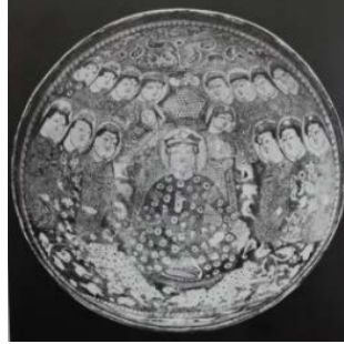
تصویر ۱۳: کاسه، کاشان، قرن ۵۷ ه.ق، زرین فام، ۳۸ سانتی‌متر (همان، ۷۰۷).