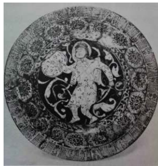
تصویر ۱۷: بشقاب زرین فام، سده هفتم هجری، ساوه (پوپ و اکرمین ۱۳۸۷، ج. ۹، ۶۴۳).