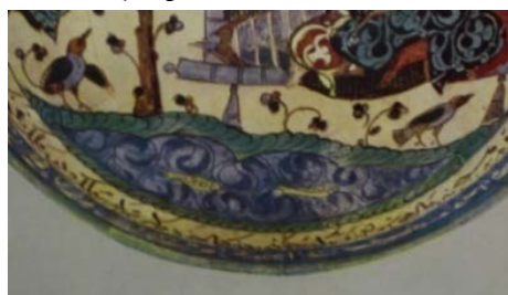
تصویر ۱۰: قسمتی از نقش کاسه، نقش کلاغ و برکه‌ای با دو ماهی، کاسه نقاشی شده رولعایی، ساوه، سده ۶ م. ق. مجموعه آن بالچ، قطر ۲۱/۶ سانتی‌متر (پوپ و اکرم ۱۳۸۷، ج. ۴، ۶۸۷).