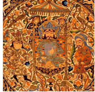
تصویر ۱۱: بخشی از پارچه ایلخانی، صحنه جلوس.