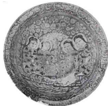
تصویر ۲: بشقاب زرین فام، سلطان آباد، سده ۷-۸ ه.ق، گالری فریر، ۴۷/۵ سانتی‌متر (پوپ و اکرم‌ن ۱۳۸۷، ج. ۹، ۷۱۵).

هم مرکز کتیبه، نقش مایه اصلی را احاطه کرده‌اند (واتسون ۱۳۸۲، ۱۲۱) و این در حالی است که در این نمونه پارچه ایلخانی، یک کتیبه در حاشیه بیرونی و آن هم به صورت ظریف بافته شده است. کتیبه بیرونی بشقاب زرین فام سلطان آباد تا حدودی با کتیبه نوشته شده بر حاشیه پارچه مد نظر مطابقت دارد (تصویر ۲). شاید بتوان گفت محدودیت‌های بافت پارچه، قابلیت اجرای انواع خطوط را فراهم نموده است.