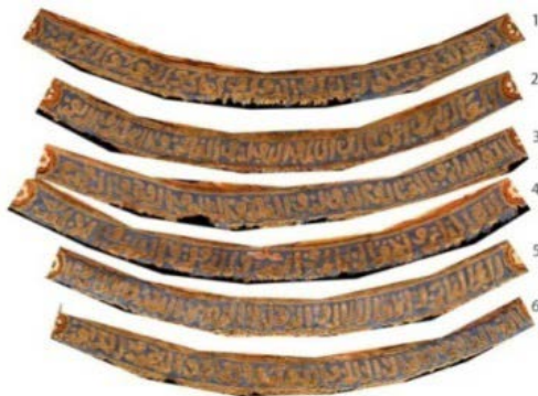
تصویر ۳: آنالیز کتیبه حاشیه بیرونی پارچه (نگارنده).