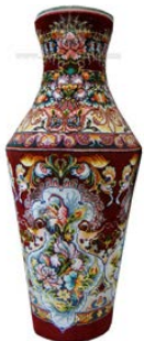
تصویر ۴: نمونه استفاده از فرش در تزئین گلدان