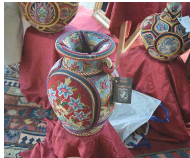
تصویر ۳: نمونه استفاده از فرش در تزئین ظروف