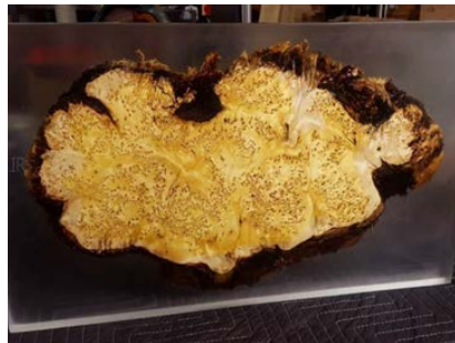
تصویر ۲: نمونه‌ای از رویکرد هم‌جواری مواد متفاوت در خلق یک محصول

مطالعه نمونه‌های موجود در بازار نشان می‌دهد که نمونه محصولات رویکرد اول یعنی هم‌جواری مواد متفاوت در کنار هم برای تولید یک شی، حاصل ترکیب حداقل دو متریاال مختلف است و اگرچه بسیاری از آنها کاربردی هستند اما الزاماً دغدغه‌ای برای معرفی فرش به‌عنوان یک عنصر مهم فرهنگی و بصری در خانه ایرانی ندارد، و این دقیقاً همان چیزی است که از انگیزه‌های انجام پژوهش حاضر بوده است. نمونه محصولات حاصل از رویکرد دوم یعنی استفاده از فرش برای تولید محصولات جانبی که به «حجمی‌بافی» شهرت دارند، اگرچه منجر به تولید آثاری جذاب و منحصر به‌فرد شده‌اند اما نهایتاً به ساخت و تولید محصولاتی غالباً تزئینی و دکوری منتهی شده است و نه محصولاتی کاربردی آن هم در حیطه طراحی داخلی منزل.