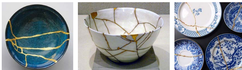
تصویر ۱: نمونه‌هایی از هنر کینسوگی (www.lifegate.com).

به طوری که ظرف، پس از کهنه و حتی شکسته شدن، نماد تجربه‌ای ارزشمند تلقی می‌شود. در این زمان ظرف از کار افتاده با طلا تعمیر می‌شود و پس از آن، در مرتبه‌ای بالاتر از عملکرد پیشین خود قرار می‌گیرد و از یک شی معمولی به یک شی گرانبها تبدیل می‌شود (تصویر ۱). کینسوگی قرار است نشان بدهد که چطور اشیاء قدیمی و نوستالژیک از کار افتاده تعمیر شده، و به ایجاد درک دوگانه‌ای از یک اتفاق منفی و بازسازی آن متمایل می‌شوند (Keulemans 2016). کینسوگی در راستای نشان دادن ارزش نوستالژی نهفته در محصول مستهلک شده و از کار افتاده و به عنوان راهی برای حفظ آن ایجاد شده است. به رغم وجود چنین رویکردهایی که در سایر فرهنگ‌ها یافت می‌شوند، در ایران، فرش‌های دست‌باف قدیمی که دیگر نمی‌توانند کارکرد اصلی‌شان را داشته باشند از چرخه مصرف خارج می‌شوند. فرش‌هایی که حاوی یک نوستالژی ارزشمند و حامل بخشی از فرهنگ ایرانی هستند.