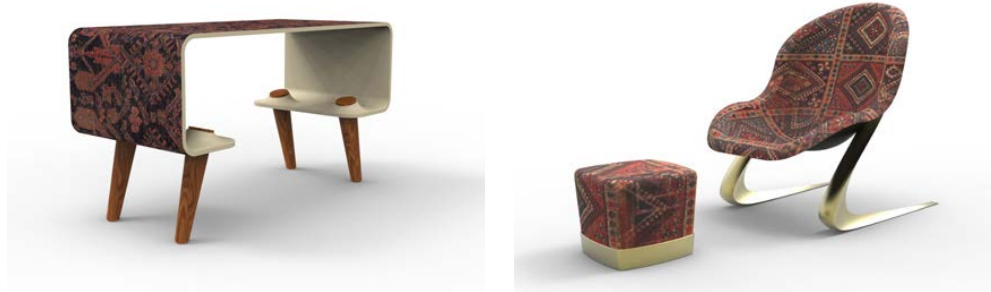
تصویر ۶: نمونه میز و نشیمن‌های طراحی‌شده با هدف استفاده مجدد از فرش دست‌باف ایرانی (طراحی و سه‌بعدی‌سازی: نگارندگان).