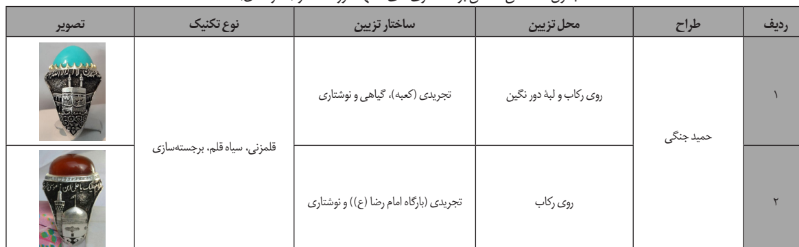
جدول ۹. اماکن مقدس بر انگشتری‌های مشهد دوره معاصر (نگارندگان).

در انگشترسازی معاصر مشهد، رکاب‌های بازاری غالباً از جنس نقره و رکاب‌های سفارشی از فدیوم بوده که یک تکه و بدون جوش هستند. بیش‌تر این رکاب‌ها با کارهای هنری از قبیل قلمزنی همراه هستند و این مسأله باعث خلق سبک جدید و خاص مشهد شده است. هنرمندان انگشترساز مشهدی، تزیین آثار را به صورت کنده‌کاری و مثبت‌کاری انجام می‌دهند و نقوش، قلمزنی می‌شوند تا برجسته شده و فرم سه‌بُعدی به خود بگیرند. هم‌چنین، بیش‌ترین مضامین به کار رفته، ادعیه، اذکار، نقوش گیاهی، حیوانی، پرنده و اماکن مقدس است که در بین افراد مذهبی بیش‌ترین خواستار را دارد. بیش‌ترین نگین‌هایی که روی رکاب سوار شده، فیروزه و عقیق هستند با اعتقادات حاصل از احادیث شیعی مرتبط هستند. حرفه انگشترسازی در گروه صنایع کوچک جای دارد و با آموزش و تولید اشتغال در فعالیت‌هایی از قبیل رکاب‌سازی، تراش نگین و ... در کارگاه‌های خانگی، رونق پیدا کرده است.