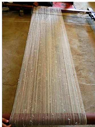
تصویر ۲: دار خوابیده جهت چله‌کشی (همان).