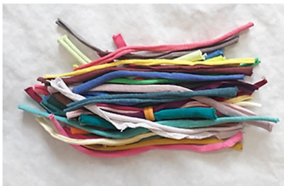
تصویر ۸: نمونه پارچه‌های کلاف شده موجود در بازار، معروف به «تریکو» (همان).

تغییر در مواد اولیه (استفاده از مواد اولیه سبک‌تر، مانند پارچه‌های حریر و کرباس) برای حمل و جابجایی آسان‌تر قالی گرو، یکی دیگر از تغییرات پیشنهادی می‌باشد. شکل سنتی قالی پرو استفاده از انواع پارچه‌ها، بدون در نظر گرفتن جنس و نوع آنها بوده که وزن دستبافته را سنگین کرده و به نوعی، در جابجایی آن مشکل ایجاد می‌نمود. با در نظر گرفتن مواد سبک و یکنواخت‌تر، می‌توان در رفع این مشکل اقدام نمود. تنوع مواد اولیه پارچه‌ها و نمونه‌های مشابه و جایگزین (پارچه‌های معروف به تریکو) با تعدد رنگی زیاد و قیمت مناسب که به صورت کلاف در بازار موجود می‌باشند، می‌توانند در روند تولید متنوع و نقشدار قالی پرو موثر باشند (تصویر ۸).