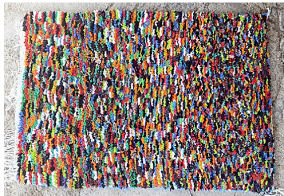
تصویر ۶: نمونه بافته شده بدون نقشه قالی پرو، بافت صغرا میر رحمتی.