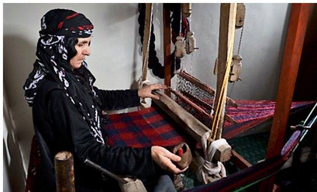
تصویر ۴: نمونه‌ای از نحوه نامناسب تابش نور و عدم وجود نور کافی در کارگاه بافندگی (عکس از مهدی کرندی). تصویر ۵: نمونه‌ای از مکان نامناسب برای بافنده (همان).