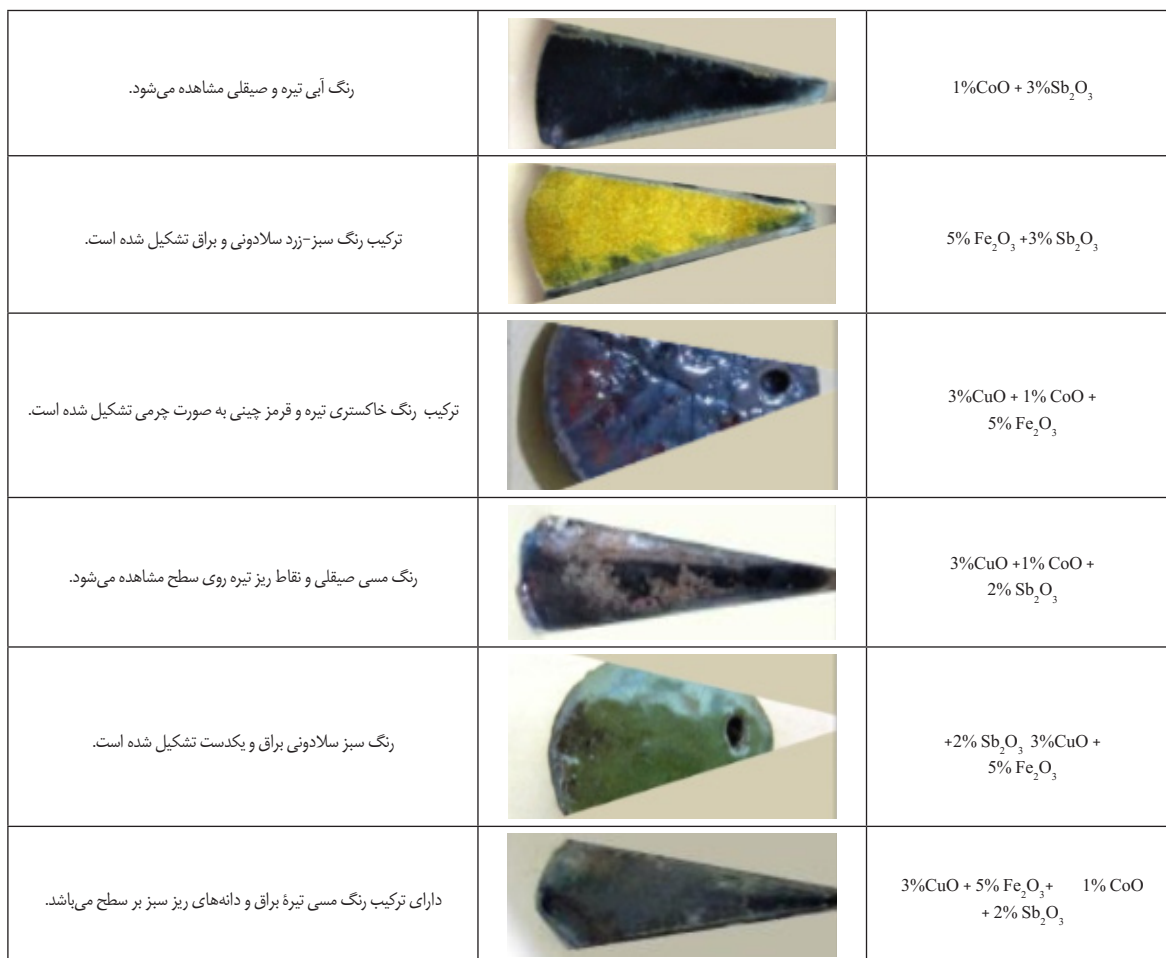
جدول ۴: نتایج احیای درون ساگار لعاب قلیایی - بوری (نگارندگان)