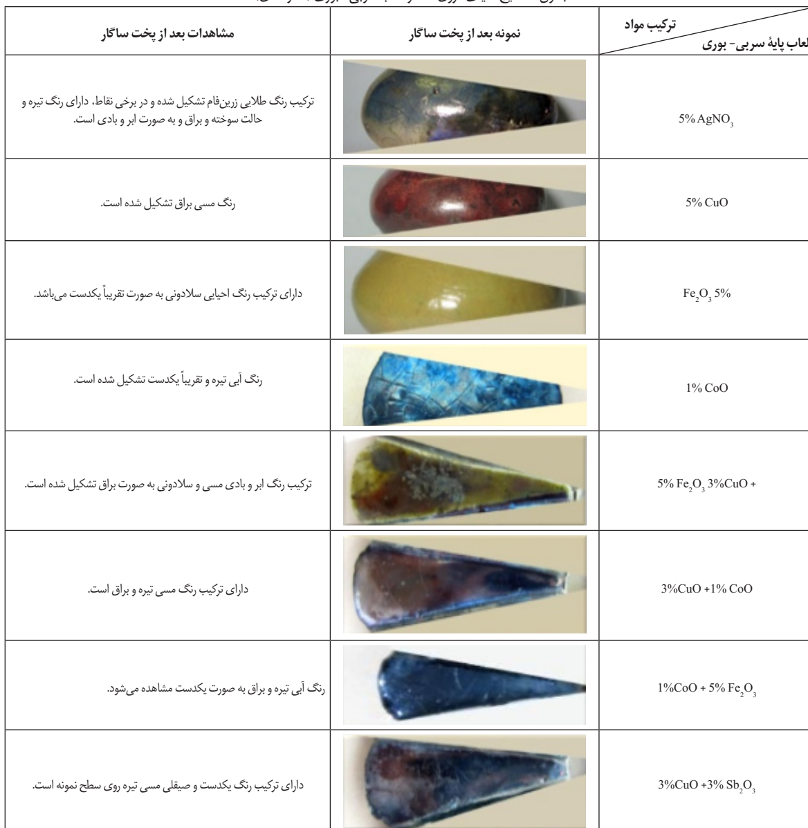
جدول ۳. نتایج احیای درون ساگار لعاب سربی - بوری (نگارندگان).

در این پژوهش، ۱۴ لعاب رنگی مختلف در هر یک از پایه‌های لعاب سربی - بوری و قلیایی - بوری که فرمول آنها قبلاً ذکر شد، ساخته و در دمای ۱۰۰۰ درجه سانتی گراد پخته شدند. بدنه مورد استفاده در همه موارد، بدنه ارتنور فریتی است. همان گونه که قبلاً اشاره شد، همه لعاب‌ها درون ساگارهایی با حجم یکسان و در مجاورت میزان مشابهی از خاکه اره، در دمای ۶۵۰ درجه سانتی گراد و در کوره برقی احیاء شدند. نتایج حاصل از احیای هر کدام از پایه‌ها به صورت مجزا در جداول (۳ و ۴) آورده شده است. جدول (۳)، نتایج مربوط به لعاب سربی - بوری و جدول (۴)، نتایج مربوط به لعاب قلیایی - بوری را نمایش می‌دهد.