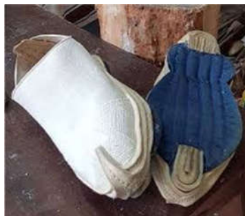
تصویر ۴: گیوه ملکی شهرستان دهاقان (نگارندگان ۱۴۰۰)