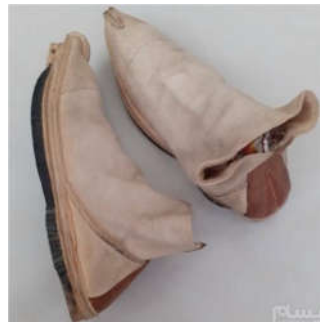
تصویر ۱۳: گیوه ملکی دوره قاجار (Url 4)