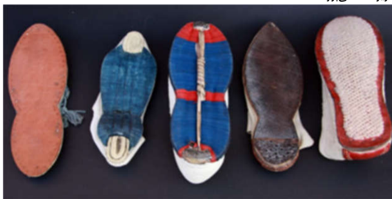
تصویر ۸: از سمت راست: گیوه تخت آجیده، گیوه تخت چرمی، گیوه تخت پارچه‌ای مناطق غرب

گیوه کلاش مخصوص مناطق کردنشین کشور بوده و محل اصلی تولید آن ناحیه اورامانات است. نوک پنجه آن گرد و تخت آن تقریباً شبیه به گیوه ملکی است (تصویر ۸) (علی‌پور ۱۳۹۹، ۲۱-۲۷).