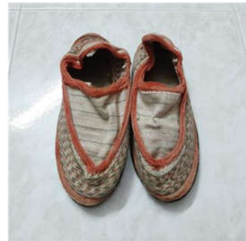
تصویر ۱۰: گیوه ملکی دوره پهلوی (Url 2)