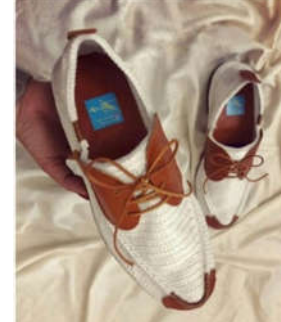
تصویر ۱۲: گیوه تلفیق با چرم، نیمه دوره معاصر (Url 3)