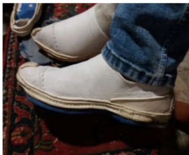
تصویر ۵: گیوه ملکی با رویه مشبک شهرستان دهاقان (نگارندگان ۱۴۰۰)

گیوه‌بافی در دهاقان از گذشته تا به امروز به دلیل نوع بافت رویه گیوه و تخت رونق خاصی داشته و به نام «گیوه ملکی» شناخته شده است. گیوه پاپوشی بسیار سبک و راحت است باعث خنکی پا و جلوگیری از عرق کردن پا شده و برای درمان درد کمر و پا و میگرن مؤثر است (تصاویر ۴ و ۵) (پاسخگویان کد ۱، ۲، ۳).