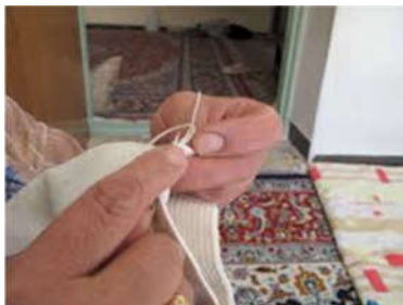
تصویر ۶: گیوه‌باف (Url 1)