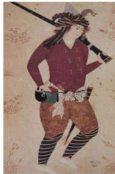
تصویر ۱۱: نگاره جوان گیوه‌پوش، دوره صفوی، مکتب اصفهان (دادور ۱۳۸۸)