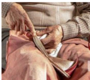
تصویر ۷: گیوه‌دوز

گیوه‌دوز به کسی گویند که رویه و تخت گیوه از پیش آماده‌شده را با چرمی به نام کمر به یکدیگر می‌دوزد و کار پایانی ساخت گیوه را انجام می‌دهد (تصویر ۷) (پاسخگوی کد ۲).