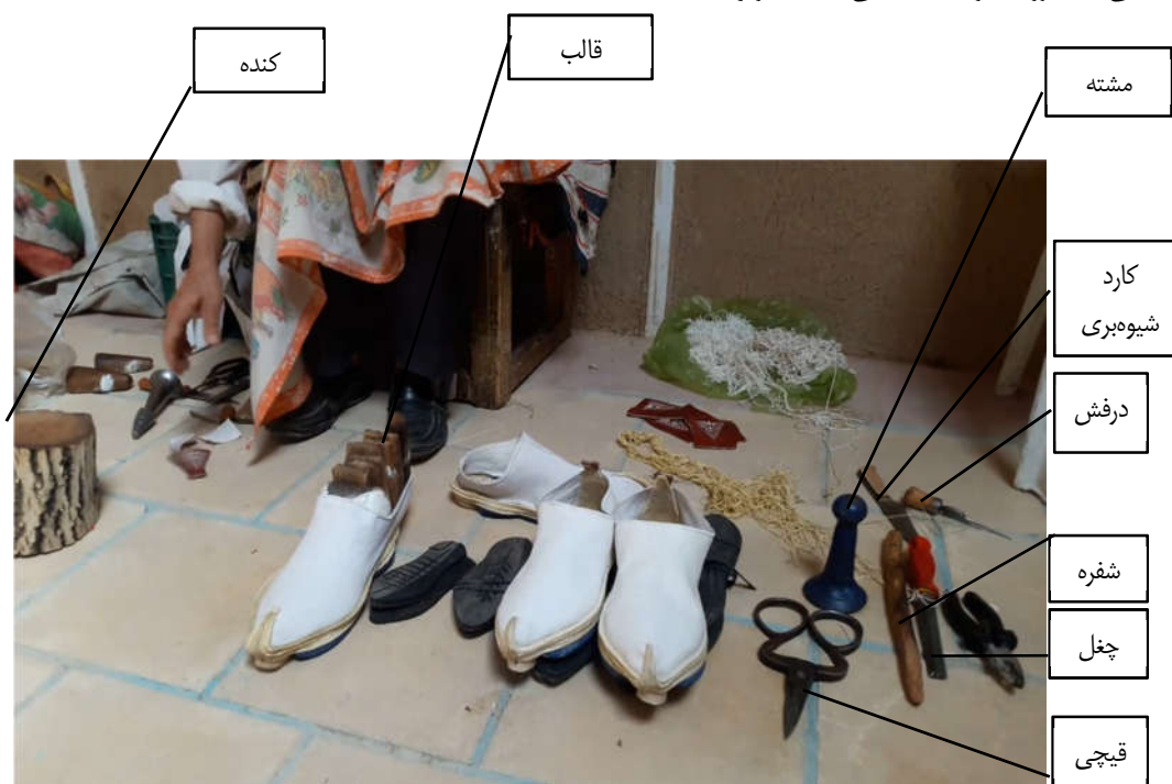
تصویر ۹: ابزار گیوه‌دوزی (نگارندگان ۱۴۰۰)

مشته وسیله‌ای فلزی است که در مشت جای گرفته و برای کوبیدن و قالب زدن استفاده می‌کنند. شفره شبیه چاقوست که جهت برش و صیقل دادن چرم‌ها کاربرد دارد. کارد شیوه‌بری، برای بریدن چرم و نخ و قسمت‌های اضافی کار و قالب، وسیله‌ای چوبی برای شکل دادن به رویه گیوه به کار می‌رود تا گیوه کوچک و بزرگ نشود. درفش در انواع مختلف بوده و در انتهای قسمت فلزی آن، دسته‌ای چوبی تهیه شده و به منظور سوراخ کردن و عبور دادن نخ کاربرد دارد. جوال دوز، سوزنی بلند است که انتهای آن، به صورت قلاب است. کُنده، ساقه‌ای (چوب درخت بَنه) استوانه‌ای شکل است که به عنوان پایه در حین ساخت تخت گیوه استفاده می‌کنند. چرم را بر روی آن قرار می‌دهند و با مشت روی آن می‌کوبند. گازانبر برای شکل دادن به رویه استفاده می‌گردد. چغل، چوبی است که زیر چرم و روی قالب جا می‌دهند. از کتیرا نیز برای صیقلی دادن رویه گیوه استفاده می‌کنند (تصویر ۹) (همان، ۴۴-۴۷).