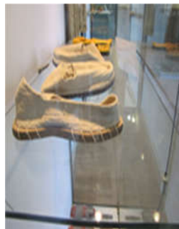
تصویر ۱۴: گیوه دوره ساسانی، موزه مردم‌شناسی کرمانشاه (Url 5)