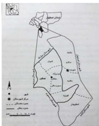
تصویر ۳: نقشه دهاقان