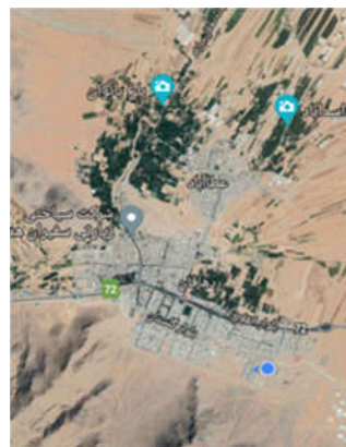
تصویر ۲: موقعیت ماهواره‌ای شهرستان دهاقان (google earth 2022)