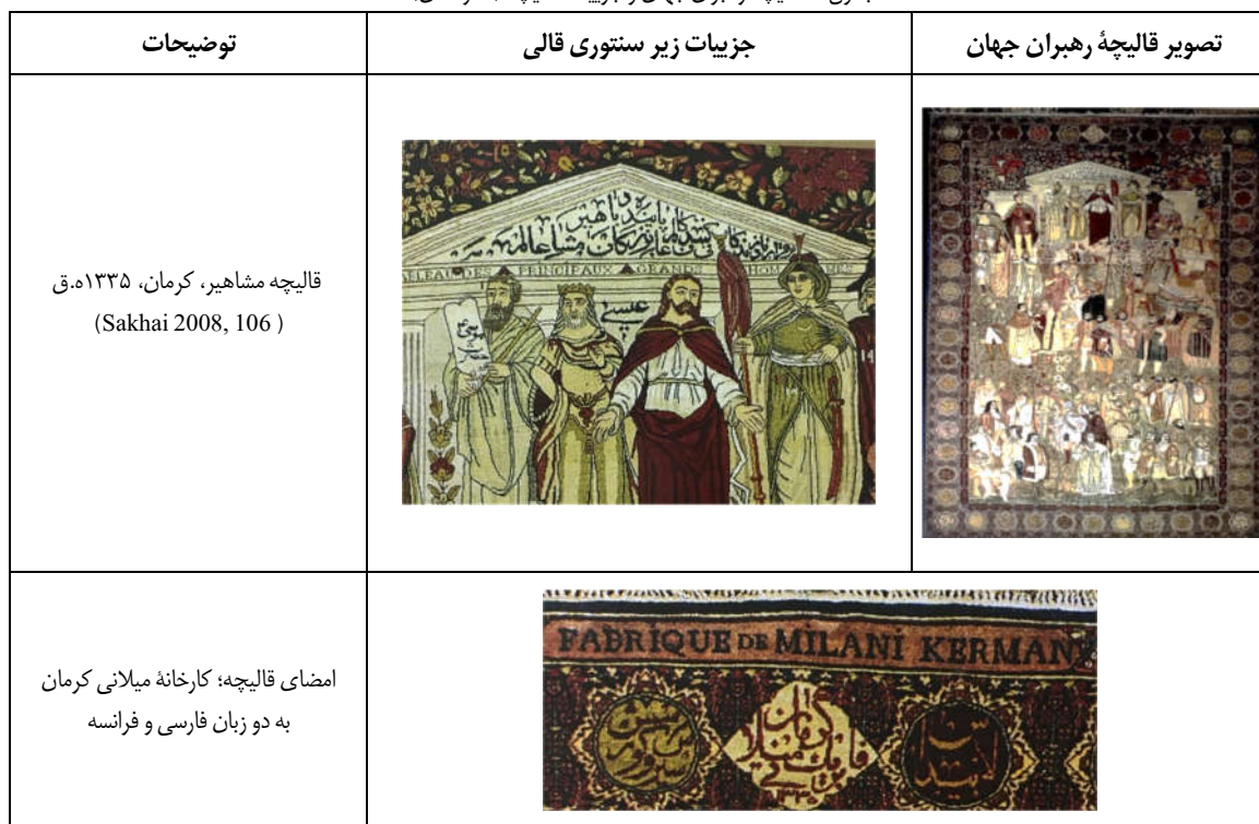
جدول ۱: قالیچه رهبران جهان و جزئیات قالیچه (نگارندگان)

در ردیف اول، از راست به چپ، عمر خلیفه ثانی، حضرت محمد (ص)، حضرت عیسی (ع)، حضرت سلیمان و حضرت موسی (ع) قرار گرفته‌اند. حضرت محمد (ص) بر روی لباس خویش، علامت ماه یا قمر دارد؛ حضرت عیسی (ع) با شنلی ارغوانی و دستانی که به سوی مخاطب کشیده شده مشاهده می‌شود؛ حضرت سلیمان دست خویش را بالا برده و حضرت موسی (ع)، ده فرمان را به دست گرفته است. در زمینه دو متن، کلامی مشاهده می‌شود. در کنار حضرت عیسی (ع)، نام ایشان و به جای متن ده فرمان، نام حضرت موسی (ع) نوشته شده است. در سنتوری‌ای که این بزرگان زیر آن قرار گرفته‌اند، نوشته شده است: «برقرار باد زندگانی کنندگان عالم و پاینده باد بزرگان مشاهیر عالم» (جدول ۱). زمینه و حاشیه‌های قالی، مملو از گل است و به سبک قالی‌های کرمان کار شده است. با توجه به آن‌که در قالیچه به بررسی جایگاه پیامبران ادیان توحیدی پرداخته می‌شود، نیاز است جایگاه این ادیان در دوره قاجار و ارتباط آنان با قالی و قالی‌بافی در این دوره مشخص گردد.