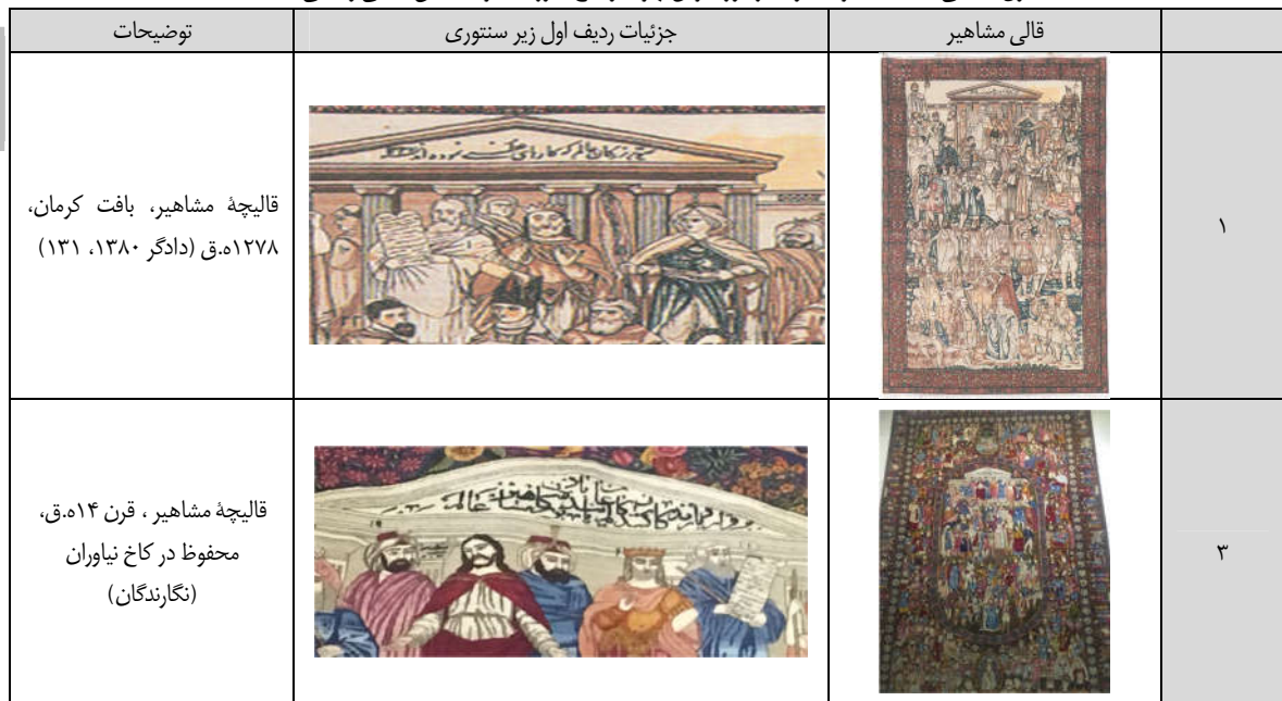
جدول ۲: قالی‌های مشاهیر محفوظ در موزه فرش تهران و کاخ نیاوران (عرفان‌منش، امانی و امانی ۱۴۰۱، ۵۷)