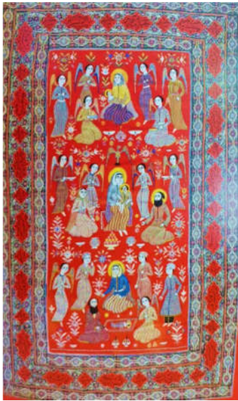
تصویر ۱: گلدوزی ۴ تشکیل شده از پشم و ابریشم، رشت، حضرت مریم و فرزندش، ۱۲۷۸ ق.م، ۲/۴۳×۱/۶۷ متر (Sakhai 2008, 390)

نسی که به آنان داده شد، در کارگاه‌های هنری نیز نفوذ پیدا کرده و کالاهایی برای خویش تولید می‌کرد. از جمله این کالاها که اذعان گردیده است جنبهٔ تعلیمی نیز داشته‌اند، منسوجاتی است با تصاویر حضرت مریم و حضرت عیسی (ع) (کشاوری و سامانیان ۱۳۸۶، ۹۲) (تصویر ۲). آنان اشاره می‌کنند که اکثر تصاویر استفاده‌شده در منسوجات که با آیین‌ها و شاعران دینی در ارتباط است، جنبهٔ یادمانی، تعلیمی و اعجاز‌آمیز دارند که می‌تواند در حکم یک شمایل باشد.