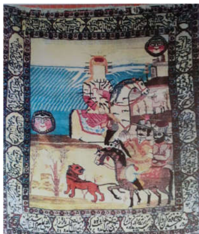
تصویر ۱: قالیچه دستبافت با موضوع واقعه کربلا، یزد، ۱۳۵×۱۰۵ سانتی‌متر (خشکنایی ۱۳۷۸، ۹۴)