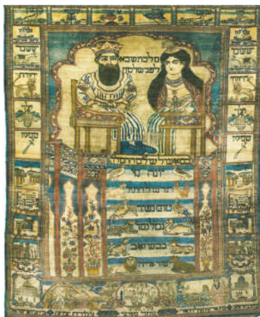
تصویر ۲: ملکهٔ صبا و حضرت سلیمان، بافت کاشان، مربوط به اواسط قرن ۱۳ ه.ق (Felton 2002, 58)

پیکرهٔ مطالعاتی این پژوهش، قالیچه‌ای است که به‌نام مشاهیر یا رهبران جهان شناخته شده است. این قالیچه، بافت کارخانهٔ میلانی کرمان است که در اندازهٔ ۲/۴۳×۱/۵۲ متر با کرک پشمی بافته شده است. متن کلامی در قالیچه به دو زبان فارسی و فرانسوی بافته شده است. امضای اصلی که نام کارخانهٔ میلانی است، در بالای قالیچه به زبان فرانسوی و در پایین حاشیهٔ بزرگ‌تر به زبان فارسی بافته شده است. قالیچه شامل سه حاشیهٔ اصلی است. اگر جهت خوانش از بیرون به درون در نظر گرفته شود، بیرونی‌ترین قسمت، حاشیهٔ باریکی است پوشیده از نقوش ختایی. در این حاشیه، در بالا به فرانسوی نوشته شده است: «کارخانهٔ میلانی کرمان» ۵ . قسمت دوم و حاشیهٔ بزرگ‌تر شامل ۵۴ شمشه است که درون هر یک از آن‌ها نام یکی از بزرگان جهان با عددی در کنار آن نوشته شده است. اعداد اختصاص یافته به پیامبران، (۱ موسی، ۲ سلیمان و ۱۸ حضرت محمد(ص) است و آخرین شماره یعنی ۵۴ به ناپلئون اختصاص دارد. حاشیهٔ باریک دیگر، شامل ۵۵ کتیبهٔ هم‌اندازه و دو کتیبهٔ بزرگ است. درون کتیبه‌های کوچک، ک نام بزرگان به زبان فرانسوی بافته شده است. درون کتیبهٔ بزرگ، نام کارخانهٔ میلانی آمده است. در زمینهٔ قالی، زیر سنتوری معابد یونانی، بزرگان جهان از موسی