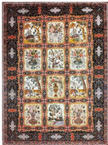
تصویر ۴: قالی گلستانی (نگاره تصویری) یک دوم و جزئیاتی از آن، تبریز، دوره پهلوی، ساختار متن: طرح قاب‌قالی با نگاره تصویری، ساختار حاشیه: اسلیمی ختایی کتیبه‌دار (حکمت‌دوست تبریزی ۱۳۹۷، ۴۹)