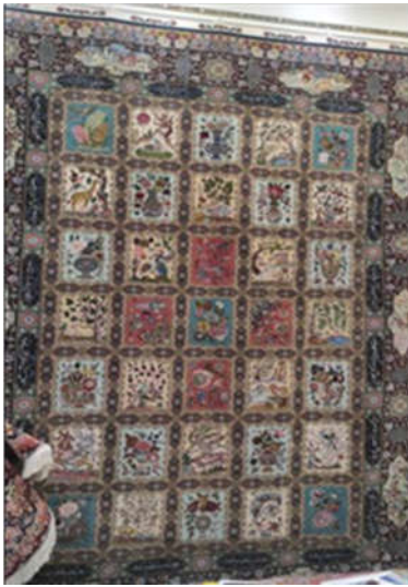
تصویر ۸: قالی گلستانی و جزئیاتی از آن، تبریز، دوره جمهوری اسلامی ایران، ۹ متری، رجشمار: ۷۰، ساختار متن: قاب‌های نگاره‌ای تصویری، ساختار حاشیه: قاب تصویری (نگارندگان)