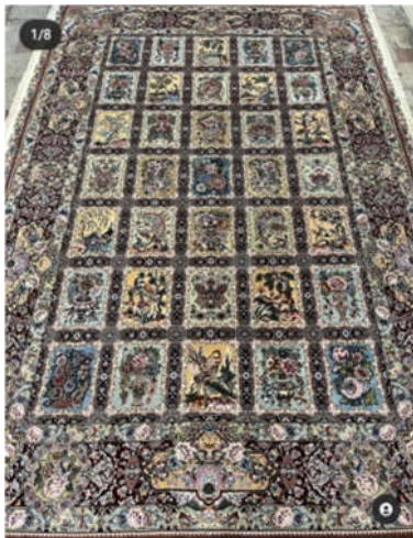
تصویر ۶: قالی گلستانی و جزئیاتی از آن، تبریز، دوره جمهوری اسلامی ایران، ۹متری، رجشمار: ۶۰، ساختار متن: نگاره تصویری جانوری، ساختار حاشیه: تجریدی (نگارندگان)