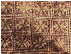
تصویر ۱: قالی پازیریک و جزئیاتی از آن، سده‌های ۴-۵ پیش از میلاد، محل نگهداری: موزه آرمیتاژ (URL1)