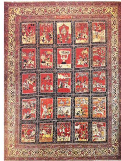
تصویر ۳: قالی گلستانی و جزئیاتی از آن، محل بافت: تبریز، دوره قاجار، ۱۲۲۰-۱۲۲۴ م. ق، ابعاد: ۳۶۵*۴۲۵ سانتی‌متر، رجشمار: ۶۰ گره متقارن، ساختار متن: نگاره تصویری، ساختار حاشیه: گردش ختایی