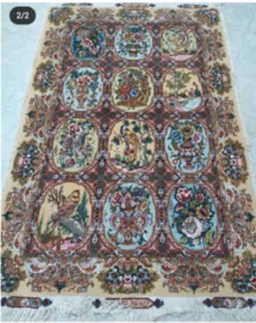
تصویر ۹: قالی گلستانی و جزئیاتی از آن، تبریز، دوره جمهوری اسلامی ایران، ذرع و نیم، ابعاد: ۱/۵*۱، رجشمار: ۵۵، ساختار متن: نگاره‌های تصویری، ساختار حاشیه: گل‌فرنگ (نگارندگان)