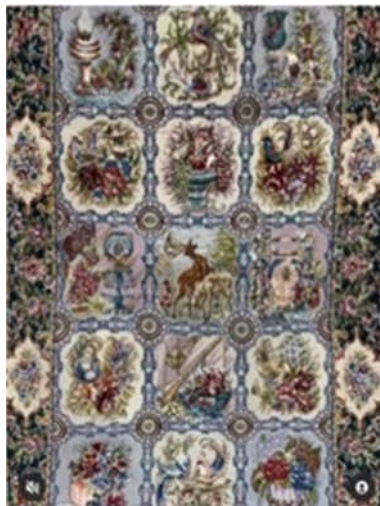
تصویر ۷: قالی گلستانی و جزئیاتی از آن، تبریز، دوره جمهوری اسلامی ایران، ذرع و نیم، ابعاد: ۱/۵*۱، رجشمار: ۶۰، ساختار متن: قاب‌قایی نگاره تصویری، ساختار حاشیه: کتیبه‌دار (نگارندگان)