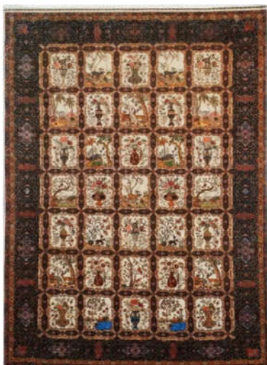
تصویر ۵: طرح گلستانی و جزئیاتی از آن، تبریز، عباسعلی اعلایف، ابعاد: ۳*۵ متر، رج‌شمار: ۵۰، تاریخ بافت: دوره جمهوری اسلامی ایران، ساختار متن: قاب‌قالی نگاره تصویری، حاشیه: اسلیمی (صوراسرافیل ۱۳۸۱، ۴۸۲)