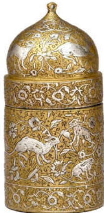
تصویر ۶: ایران، خراسان، سده ۷ ه.ق، دارای کتیبه‌ی نسخ، تزیینات گیاهی و هندسی (URL6)

درهم تنیده شده و غالباً به سر حیوانات منتهی شده‌اند و یا به صورت سیاه‌قلم یا مرصع در پس‌زمینه نقوش هندسی، انسانی، صور فلکی و ... کار شده‌اند.