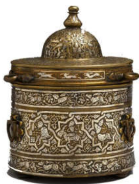
تصویر ۳: احتمالاً ایران، خراسان، سده ۷ ه.ق، دارای کتیبه نسخ، تزیینات گیاهی، جانوری، انسانی، هندسی و صور فلکی (URL3)

این مرکب‌دان دارای تزیینات بسیار زیبایی می‌باشد. بدنه به سه قسمت تقسیم شده که در دو نوار باریک‌تر بالایی و پایینی، نقش حیواناتی در حال تعقیب و گریز حک و نقره‌کوبی شده‌است. مابین صحنه تعقیب‌و‌گریز شیر و حیوانی نظیر آهو، با نقوش گیاهی پر شده‌است. قسمت میانی، نقوش ترکیبی صور منطقه البروج با خداوندان را نشان می‌دهد که نشان‌دهنده سنت خراسانی است. هنر طالع‌بینی که ابتدا از طریق متون یونانی به جهان اسلام معرفی شد، جزء لاینفک علم نجوم تلقی شد. ترسیم صور نجومی بر روی اشیاء گران‌بها از این قبیل در جهان اسلام رواج بسیار یافت و تصور می‌شد که وجود چنین تصاویری بر روی این اشیاء، ویژگی‌های کیهانی و طلسم‌شناختی را در آن‌ها ایجاد می‌کند و در نتیجه صاحبان آن‌ها را تحت تأثیر فرخنده ستارگان قرار می‌دهد. نقوش داخل طرح هشت و چهار (هشت و چلیپا)، در قسمت هشت (شمسه) با ۱۲ صورت فلکی و در قسمت چلیپا با ساقه‌های اسلیمی منتهی به سر حیوانات، تزیین و با نقره مرصع شده‌است. در این بخش لولا و پلاک‌هایی قرار دارد که به موازات آن‌ها روی درپوش، گیره‌ای نیز وجود دارد که سه صورت فلکی (سرطان، عقرب و حوت) به دلیل کمبود فضا و حفظ ماهیت تزیینی بر روی این حلقه‌ها تصویر شده‌اند (تصویر ۳).