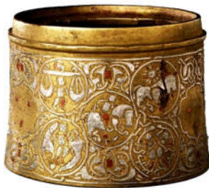
تصویر ۴: ایران، سده‌های ۶ و ۷ ه.ق، دارای تزیینات گیاهی، جانوری، انسانی و صور فلکی (URL4)