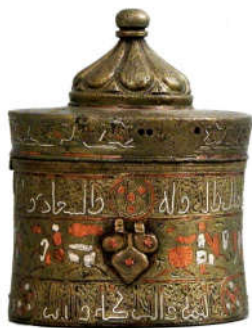
تصویر ۲: شرق ایران (خراسان) یا افغانستان، سده ۶ ه.ق، دارای کتیبه نسخ و کوفی، تزئینات گیاهی، جانوری و انسانی (URL2)

درپوش مرکب‌دان دارای برآمدگی گنبدی شکل ترک‌دار بر روی سطحی صاف می‌باشد. این قسمت مسطح و پایه عمودی آن دارای تزئینات خوشنویسی و اشکال گیاهی هستند. بر روی بخش مسطح درپوش، دو نوار به موازات هم بر لبه قرار گرفته‌اند و چهار دایره منقوش در سه بخش به صورت قرینه (مجموعاً ۱۲ دایره) روی دو نوار ترسیم شده‌اند. درون نوارها به خط کوفی جملات «بالیمن و البرکه [...] و السعاده و الد [...]» و «الدولة و السلامة و النصر و البقا لصاحبه [...]» نوشته شده‌است. فرم ترک‌دار گنبدی شکل درپوش به نقل از ملکیان شیروانی استعاره از گنبد نیلوفری در ادبیات است. تصویر این گنبد از بالا شبیه نقش گل هشت‌پر (رزت) نیز می‌باشد. قسمت خارجی کف مرکب‌دان نیز دارای تزئینات بسیار ظریفی شامل یک دایره در مرکز است که درون آن نقشی شبیه خورشید با مس مرصع شده و نوار دایره‌ای شکل دوم به صورت ساقه اسلیمی است. نوار سوم که پهن‌تر می‌باشد ۱۸ بار تکرار طرح برگ نخلی حک شده و مرصع را دربر می‌گیرد. در نوار آخر، شش دایره جدا از هم نقش بسته‌اند که مابین دایره‌ها یکی درمیان، کتیبه خوشنویسی (بالیمن و البرکه و ...) و نقش شیر جای دارد (تصویر ۲).