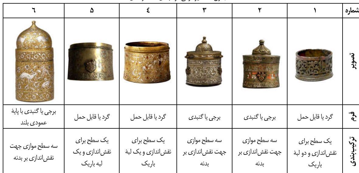
جدول ۲: آنالیز فرمی مرکب‌دان‌ها (نگارندگان)

مرکب‌دان‌های شماره‌های ۲-۵ که متعلق به سده‌های ۶-۷ ه.ق هستند، همگی دارای حلقه‌های اتصال، پلاک و گیره در اطراف بدنه خود هستند که در برخی نسبتاً سالم و کامل مانده و در برخی (مانند نمونه ۴) فقط میخ‌های اتصال آن باقی مانده است که دلالت بر وجود پلاک و حلقه اتصال مفقود دارد. در زمان استفاده از این مرکب‌دان‌ها، بندهایی از این حلقه‌ها عبور می‌کرده و مرکب‌دان توسط این بندها به حمایل و کمر بند شخص متصل می‌شده است اما حلقه اتصال مرکب‌دان (۶) که به دوره صفوی تعلق دارد، در بالای درپوش آن و دقیقاً در رأس فرم گنبدی‌شکل آن و به صورت یک حلقه ساده است. مرکب‌دان (۱) از سده ۷ ه.ق نیز بدون حلقه و پلاک می‌باشد.