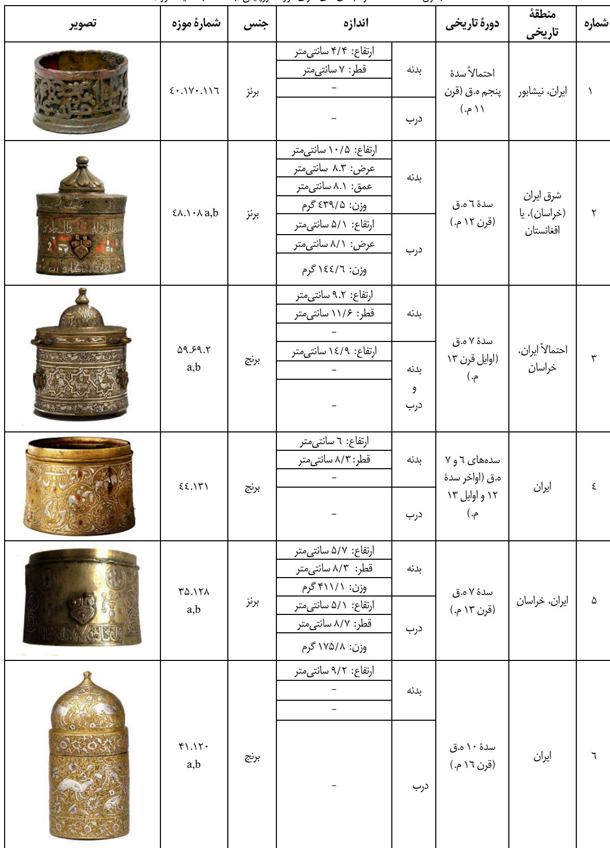
جدول ۱: اطلاعات مرکب‌دان‌های فلزی موزه متروپلیتن (با استناد به سایت موزه)