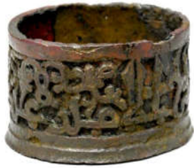
تصویر ۱: ایران، نیشابور، احتمالاً سده ۵ ه.ق، دارای کتیبه کوفی گلدار (URL1)

مرکب‌دان شماره (۱): این مرکب‌دان فلزی با نام «مولى الامير عبد الله بن الحسن پارس» متعلق به قرن ۵ ه.ق / ۱۱ م. است. این نام دورتا دور بدنه آن با خط کوفی گل‌دار حک شده‌است. بدنه آن حالت مدور و استوانه‌ای شکل دارد و مربوط به منطقه نیشابور می‌باشد. جنس آن از مفرغ (برنز) و به روش ریخته‌گری ساخته شده است. این مرکب‌دان از نوع بدون درب می‌باشد و سطح زیرین و داخلی آن ساده و بدون تزئین است. یک نوار ساده، بخش لبه بالایی آن و دو نوار ساده نیز به موازات هم بخش لبه زیرین آن را در بر گرفته است (تصویر ۱).