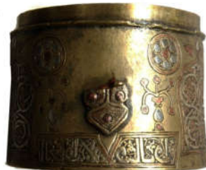
تصویر ۵: ایران، سده ۱۰ ه.ق، دارای تزیینات گیاهی و جانوری (URL5)