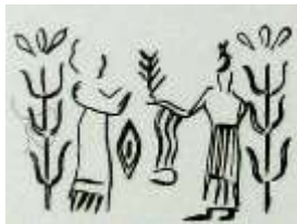
تصویر ۴: مهری از شوش (Amieit, 1979: 34)

در موارد بسیاری، چهار شاخه از یک ظرف خارج می‌شود که نماد چهار رود سمبلیک جاری در جهان است (Gelfer, 1986: 54). بازتاب این ارتباط در توصیفات مربوط به بهشت آمده است که چهار رود در پای درخت زندگی روانند (شوالیه و گربران، ۳۸۷، ۱۳۵). باید به این نکته توجه داشت که بنا بر متن مینوی خرد، در متون زرتشتی گاومرد در حال انجام عملی آیینی در جایگاه درخت مقدس، درخت بس‌تخمه و درخت گنوکرن وصف شده است. این عمل آب‌فشانی مقدس بر مکان مقدس است (تفضلی، ۱۳۵۴: ۷۹). «ایرانویج» ۷ محل آفرینش درخت گنوکرن و درخت بس‌تخمه و جایگاه دریای فراخکرد است (قلی‌زاده، ۱۳۸۸: ۱۱۰). آب‌فشانی مقدس در جایگاه درخت زندگی و آب‌های زندگی‌بخش، خویشکاری گاومرد توصیف شده است. این تقدس یک کهن‌الگوی ذهنی بشر است و همواره ارتباط انسان و طبیعت با نوعی مراسم و احترام همراه بوده است (Hopfe, 1983: 22).