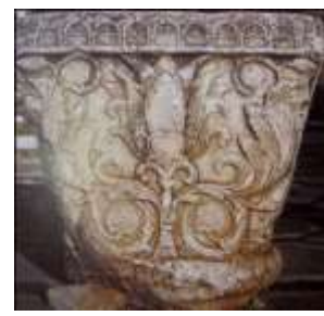
تصویر ۱۳: سرستون یافت‌شده از بیستون (خوانساری، ۱۳۸۳: ۵۰)

پیچان، بخشی از محراب را تزئین کرده‌است (نک. پوپ و آکرمن، ۱۳۸۷: لوح ۲۵۹ الف). همه این نشانه‌های گیاهی، تداعی‌کننده درخت زندگی هستند و مشابهت‌های بسیاری با آثار ساسانی دارند. دیگر عنصر مرتبط با آب حیات، سبو است. در محراب دوره اسلامی «ساراگوزا» در مادرید، سبو به‌شکل مستقل در کنار محراب قرار گرفته‌است (Sourdel, 1973: Image 181). در نمونه‌هایی از محراب‌های ایران دوره اسلامی، مشابه آن‌چه در آثار هنری لرستان، املش و مارلیک دیده شد، سبو در بالا یا پایین درخت انتزاعی قرار می‌گیرد (تصاویر ۱۸-۲۱).