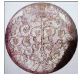
تصویر ۱۶: بشقاب زرانود، دوره ساسانی (خوانساری، ۱۳۸۳: ۱۵۴)

در محراب گچبری شده مکشوفه از تپه ارگ ری متعلق به سده سوم ه.ق، آرایه‌ای به‌شکل سبو بر فراز ستون‌های کناری به‌خوبی آشکار است (تصویر ۱۸). در محراب سنگی مسجد میمه متعلق به سده ۶ ه.ق، سبو در بالای ستونی قرار گرفته که با آرایه‌های گیاهی تزئین شده‌است (تصویر ۱۹). قندیل آویخته در قلب محراب، نماد نور است (سجادی، ۱۳۷۵: ۲۷۳). در این محراب‌ها سبو در بالا قرار گرفته و آیات قرآن به‌عنوان نشانه‌های برکت آسمانی در سبو نازل شده‌اند. کارکرد سبو در بالای درخت مقدس که باران‌خواهی و برکت‌خواهی براساس اسطوره‌های ایرانی توصیف شده‌بود، در دوره اسلامی با تغییرات تصویری در محراب‌ها باقی مانده‌است. نمونه‌هایی از این نوع تصویرگری در دیگر محراب‌ها نیز به‌چشم می‌خورد. در محراب‌های مساجد اصفهان از جمله محراب مسجد شاپورآباد، مسجد هفتشویه،