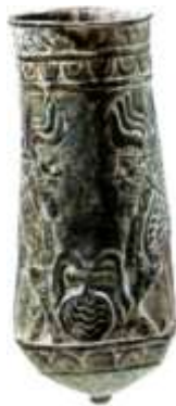
تصویر ۲: جام برنزی از لرستان، احتمالاً هزاره اول ق.م (Sterlin, 2006: 67)