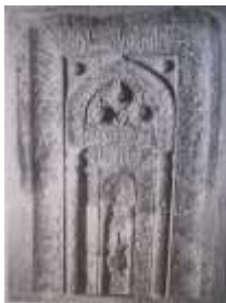
تصویر ۱۹: محراب سنگی مسجد میمه (همان: ۲۷۳)

مفهوم نمادین آب و درخت در هنرهای کهن ایرانی و نمود آن بر محراب‌های دوره... حسین عابدوست و همکاران. ۴۲:۲۳