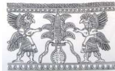
تصویر ۱: ساغر لرستان (Mahboubian, 1997: 404)

در موارد بسیاری، چهار شاخه از یک ظرف خارج می‌شود که نماد چهار رود سمبلیک جاری در جهان است (Gelfer, 1986: 54). بازتاب این ارتباط در توصیفات مربوط به بهشت آمده است که چهار رود در پای درخت زندگی روانند (شوالیه و گربران، ۳۸۷، ۱۳۵). باید به این نکته توجه داشت که بنا بر متن مینوی خرد، در متون زرتشتی گاومرد در حال انجام عملی آیینی در جایگاه درخت مقدس، درخت بس‌تخمه و درخت گنوکرن وصف شده است. این عمل آب‌فشانی مقدس بر مکان مقدس است (تفضلی، ۱۳۵۴: ۷۹). «ایرانویج» ۷ محل آفرینش درخت گنوکرن و درخت بس‌تخمه و جایگاه دریای فراخکرد است (قلی‌زاده، ۱۳۸۸: ۱۱۰). آب‌فشانی مقدس در جایگاه درخت زندگی و آب‌های زندگی‌بخش، خویشکاری گاومرد توصیف شده است. این تقدس یک کهن‌الگوی ذهنی بشر است و همواره ارتباط انسان و طبیعت با نوعی مراسم و احترام همراه بوده است (Hopfe, 1983: 22).