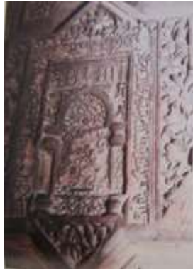
تصویر ۲۱: نمونه مثبت‌کاری شده محرابی روی منبر مسجد جامع اصفهان (سجادی، ۱۳۷۵: ۲۸۲)

در محراب مسجد میدان کاشان، سبو بر فراز ستون‌هایی قرار گرفته که نقش مایه‌های انتزاعی گیاهی آن را تزئین کرده است (تصویر ۲۰). نمونه زیبایی از وجود سبو در بالا و پایین ستون محراب در طرح محرابی مثبت‌کاری شده بر منبری در کنار محراب اولجایتو در مسجد جامع اصفهان دیده می‌شود (تصویر ۲۱).