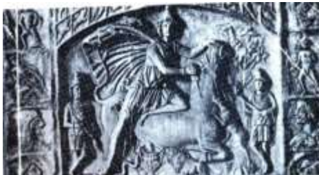
تصویر ۱۰: نقش برجسته میترایی (فلاح‌زاده، ۱۳۸۴: ۱۱۷)