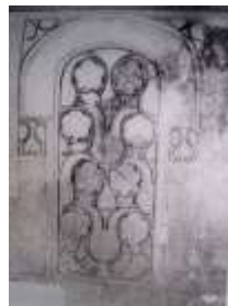
تصویر ۱۸: محراب گچبری از تپه ارگ ری (سجادی، ۱۳۷۵: ۲۴۵)