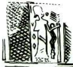
تصویر ۵: مهری از شوش (Amieit, 1979: 36)