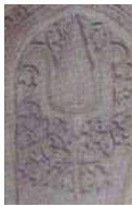
تصویر ۱۴: محراب امامزاده کرار و جزئیات آن، بوزان اصفهان (ابوذری، ۱۳۸۷: ۱۴۳)