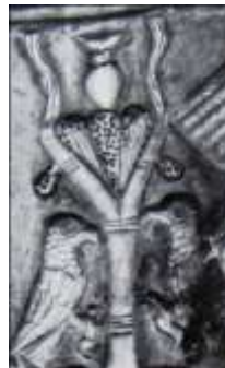
تصویر ۶: ظرف فلزی از املش و جزئیات آن (Ghirshman, 1966, Image 7)