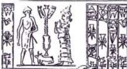
تصویر ۸: مهری از شوش، به سبک بابلی کهن (Roch, 2008: 430)

حال باید در جستجوی مواردی بود که در پیشینه تصویرگری هنر ایران جام یا سبوی را بر فراز درخت یا ستون نمایش دهد. در یک نمونه از املش (تصویر ۶)، درخت زندگی درحالی به تصویر کشیده شده است که گاو مردمان بالدار محافظ آن هستند. در این نمونه تاریخی، سبوی در بالای درخت قرار گرفته است. ترکیب‌بندی صحنه، درخت میانی و دو محافظ اسطوره‌ای و دو پرند را دربردارد که از همان نوع ترکیب‌های سه‌گانه مقدسی است که همواره با درخت زندگی در آثار هنری ظاهر می‌شود و گلان از آن با نام «سه‌گانه مقدس» یاد کرده است (Golan, 2003: 379). در مواردی به جای ایزدبانو در مرکز که سبویی در دست یا بر سر دارد، نمادهای مرطوب قرار می‌گیرند (ibid: 381).