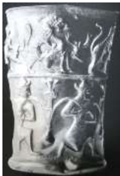
تصویر ۳: ظرفی از املش سده‌های ۱۰ و ۹ ق.م (Gelfer, 1986: 54)

نمونه‌ای از ارتباط سبوی پر آب با درخت مقدس را می‌توان در ساغری از لرستان مشاهده کرد (تصویر ۱). بر روی این ساغر، جنیان بالدار با سر پرنده، دو سوی گلدانی قرار گرفته‌اند که درختی در آن ریشه دارد. گلدان با خطوط مواج به نشانه آب، تزیین شده و دو جوی آب از آن روان است. محل اتصال درخت به گلدان یک گل چندپر قرار دارد (Mahboubian, 1997: 404). جام برنزی لرستان (تصویر ۲) نیز دو اسفنجس بالدار را نشان می‌دهد که دو طرف سبوی پر آبی قرار گرفته‌اند. اسفنجس‌ها کلاه سه‌شاخ بر سر دارند که نماد قدرت و نماد ایزدی است (Sterlin, 2006: 67). در نمونه گلدان طلایی متعلق به املش (تصویر ۳)، گاومرد در حالی ایستاده که درختی روبه‌رو و گلدانی در دست دارد و شاخه‌های درخت در گلدان ریشه دوانده‌اند.