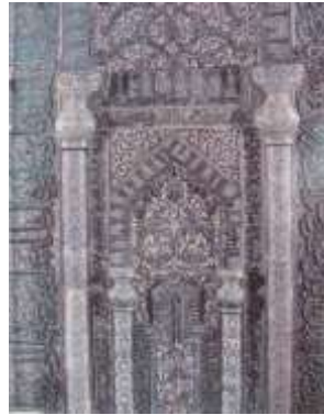
تصویر ۲۰: محراب مسجد میدان کاشان (فریه، ۱۳۷۴: ۲۷۱)

با مقایسه نمونه‌های تزئینی سبو و درخت در محراب‌های دوره اسلامی، این نکته به روشنی قابل درک است که یک الگوی ثابت اولیه در همه آثار تکرارشدنی است. آرایه گیاهی هم‌چون درخت نمادین یا گردش‌های ماریچ گیاهی در محراب‌ها به چشم می‌خورد. سبو، نماد آب‌های حیات‌بخش نیز حضور بارزی در محراب‌ها دارد. این همان اصل اولیه نظریه تطویرگرایی است که حضور الگوهای شناخته‌شده ذهنی را برای بشر بیان می‌دارد و با تکیه بر وحدت روانی و ذهنی انسان‌ها، از اشتراکات ذهن بشری نتایج کلی و جهانی اتخاذ می‌کند (Pals, 1996: 46). باور ابتدایی تقدس عناصر طبیعی و احترام به آن هم‌چون امری قدسی در زیر پوسته انطباق فرهنگی و