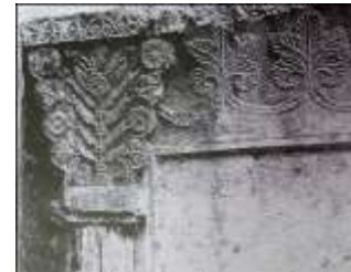
تصویر ۱۲: سرستون و بخشی از آفریز، دیوار انتهای مغاره طاق‌بستان (پوپ و آکرمن، ۱۳۸۷: لوح ۱۶۸)