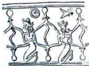
تصویر ۷: مهر سیلندری عیلامی، چغازنبیل، محفوظ در موزه ملی ایران (Porada, 1963, 68)

در آثار هنری مختلف، درخت زندگی به دو شیوه تزیینی ظهور یافته است؛ یکی ستون‌هایی که ریشه در گلدان یا سبویی دارند و گاهی نیز سبویی در بالای ستون قرار دارد و دوم درختی که در میانه یا مرکز قرار گرفته و گاهی ریشه در سبوی یا گلدانی دارد و قندیلی به نشانه نور و آتش بر فراز آن آویخته است. این نوع تصویرگری، یادآور رابطه اسطوره‌ای درخت زندگی و درخت کیهانی با نور و آتش است که هم‌چنان که مطرح شد درخت کیهانی، مرتبط با نور و آتش است زیرا آذرخش در قلب آن جای دارد و ماه و خورشید بر شاخه‌هایش می‌تابند (دوبوکور، ۱۳۸۷: ۹). اما در محراب، سبوی در ریشه درخت قرار نگرفته است و حضور آن در بالای ستون‌های محراب قابل توجه است، درحالی که آیات قرآن که نماد برکت آسمانی است در آن نزول می‌کنند.