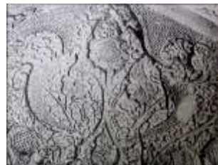
تصویر ۱۷: نگاره درختی - گیاهی در محراب گنبد علویان (پوپ و آکرمن، ۱۳۸۷: لوح ۳۳۱)