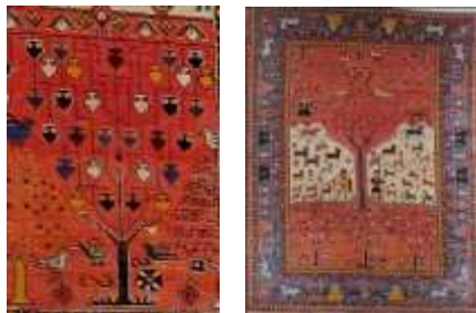
تصویر ۹: قالی ملایر، سده ۱۴ ه.ق و جزئیات آن (Hali, 2002: 32)

مهر سیلندری از عیلام (تصویر ۷)، سبوی آسمانی و زمینی را نشان می‌دهد که موجوداتی با کلاه شاخدار نمادین ایزدی دو سوی آن قرار گرفته‌اند. تصویر این مهر، سبویهای مقدس را نشان می‌دهد که آب‌های آسمانی از آن جاری است و در عین حال، دریافت‌کننده آب بر زمین هستند. در مهری از شوش (تصویر ۸)، صحنه قابل توجهی به تصویر کشیده شده است که ارتباط گاو با آذرخش و باران را نشان می‌دهد و شخصیت ایزدی در سمت راست و خدمتگزار در سمت چپ قرار گرفته‌اند و بر پشت گاو نشسته در میان دو شخصیت، نشان صاعقه وجود دارد. «این نشان در بین‌النهرین به دست خدایی است که قدرت طوفانها را دربردارد» (بلک، ۱۳۸۵: ۱۸۴). در این تصویر، سبویی که بر فراز ستون قرار گرفته با آب و رطوبت مرتبط است و رطوبت از نشانه‌های خدای آذرخش است. براساس روایت‌های اسطوره‌ای، آب و گیاه زندگی‌بخش در جهان فیزیک قابل دستیابی است و پدیده‌های نامعمول و غیرعادی مانند موجودات ترکیبی با آن همراهند. این