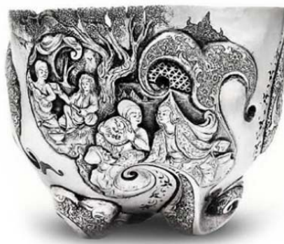
تصویر ۱۲: کاسه یکپارچه چکشی، برجسته‌کاری و ریزقلم، نقره، اثر محمد حیدری، آرشیو نگارخانه مس‌نگار (URL3)