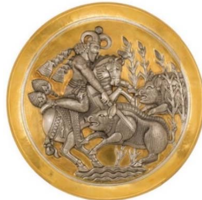
تصویر ۱۵: بشقاب قلمزده نقره مطلا به همراه تصویر بزرگمایی نقوش آن، طرح ساسانی، اثر حبیب آروان، آرشیو نگارخانه مس نگار (URL3)