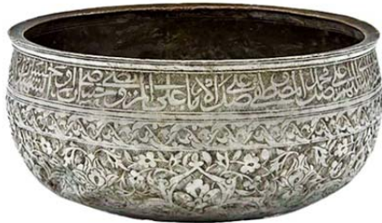
تصویر ۱: دیگ مسی، ایران، سده ۱۰ ه.ق / اوایل قرن شانزدهم م.، محفوظ در موزه هرمیتاژ (URL2).

یا غالباً چهارده معصوم؛ ۲) ذکر نام حضرت علی (ع)؛ ۳) اشعاری در ستایش حضرت علی (ع) (ملکیان شیروانی، ۱۳۸۵: ۲۸۱). جوانیان، رشد فزاینده کتیبه‌نگاری را حاصل منع صورت‌نگاری در عصر صفوی می‌داند (۱۳۹۰: ۳۶۶).