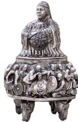
تصویر ۱۳: شکلات‌خوری چکشی قلمزده نقره، اثر محسن براتی، آرشیو نگارخانه مس نگار (URL3)