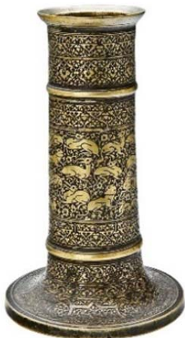
تصویر ۵: پایه شمعدان برنجی، ایران، اواخر قرن ۱۱ و اوایل قرن ۱۲ هجری قمری، محفوظ در موزه هرمیتاژ (URL2)