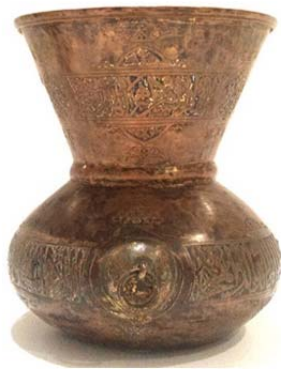
تصویر ۴: قندیل مسی، اردبیل، اواخر قرن ۱۰ و اوایل قرن ۱۱ ه.ق.، محفوظ در بخش دوران اسلامی موزه ملی ایران.

در نظام های سلطنتی، مدح و ستایش حاکمان امری رایج بوده است. آثار قلمزنی صفویه نیز از این امر مستثنا نیستند. سفارشی سازی این آثار برای درباریان باعث شده تا شاهد کتیبه هایی در مدح شاهان و مقام های سیاسی وقت باشیم. تصویر (۴) مربوط به قندیلی مسی با سه دسته نگهدارنده است. قسمت زیرین لبه و سطح بدنه این قندیل با شمشه ها و کتیبه هایی مزین شده است. این کتیبه ها به خط ثلث هستند و سه شمشه دایره ای شکل با نقوش گیاهی کتیبه پایینی را به سه بخش تقسیم کرده اند. متن کتیبه ها به عربی و سراسر مدح و ستایش شیخ صفی الحق است (افروغ، ۱۳۹۲: ۹۲). این اثر متعلق به شهر اردبیل است (فراست، ۱۳۸۴: ۶۸). مضمون متن در بسیاری از کتیبه های آثار عصر صفوی، صاحب آن را مخاطب قرار می دهد و به مدح و ستایش او می پردازد. این امر بیان گر تأثیر و نفوذ مستقیم دربار در طراحی و ساخت این آثار است، چراکه اغلب سفارش دهندگان از دولتمردان بوده اند.