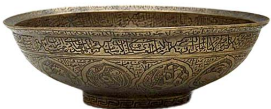
تصویر ۷: جام چهل کلید برنجی، ۱۰۳۶-۱۰۳۷ ق.ه / ۱۶۲۷-۱۶۲۸ م.ه، محفوظ در موزه هرمتناژ (URL2)