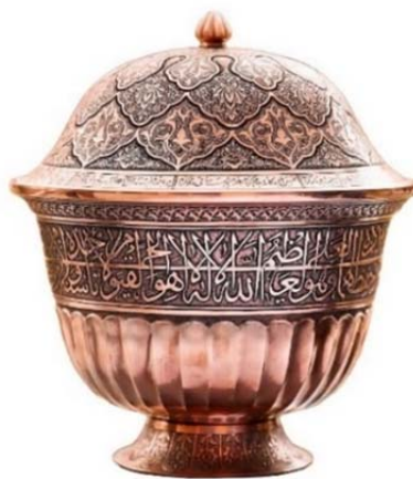
تصویر ۸: کاسه درب‌دار مسی، ساخت پیکره توسط نیکوبخت، خوشنویسی اثر رحیمی، طرح و قلم از منصور حافظ‌پرست، آرشیو نگارخانه مس‌نگار (URL3)