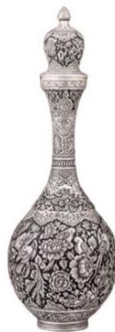
تصویر ۱۱: تنگ دربدار نقره به همراه تصویر بزرگنمایی نقوش آن، اثر محراب دامادی، آرشیو نگارخانه مس‌نگار (URL3)