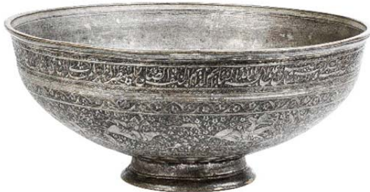
تصویر ۶: کاسه پایه‌دار (جام)، ایران، تبریز، ۱۶۳۰-۱۶۵۰ میلادی برابر با ۱۰۳۹-۱۰۵۹ هجری قمری، محفوظ در موزه ویکتوریا و آلبرت (URL1)

تصویر (۶) متعلق به یک کاسه مسی پایه‌دار با موضوع شکارگاه است. بالای ظرف، کتیبه‌ای نواری با محتوای صلوات امامان شیعه (ع) کار شده است. بر بدنه جام دو سوار شکارچی در حال شکار و دو خرگوش در حال گریزند. یک قلاده سگ شکاری نیز در صحنه شکار حاضر است.