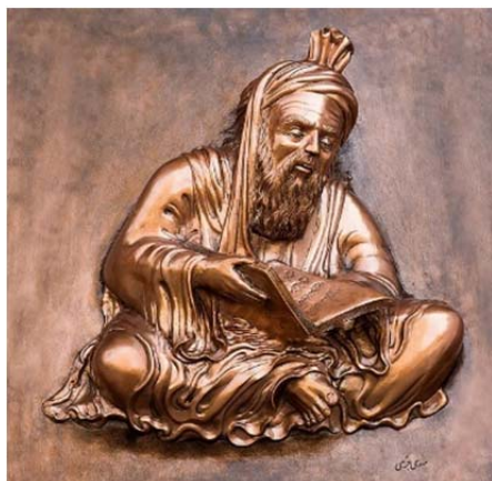
تصویر ۱۰: تندیس ابوالقاسم فردوسی، اثر مهدی جزی، آرشیو نگارخانه مس نگار (URL3)

در دورهٔ معاصر تندیس‌سازی جهت تقدیر و بزرگداشت مشاهیر علم، فرهنگ، ادب و هنر جای مجیزگویی را گرفته است. هرچند هنرمندان و صورت‌نگران دورهٔ صفوی آزادی بیش‌تری در نگارگری تصاویر انسان نسبت به دوره‌های پیشین داشتند (احسانی، ۱۳۹۰: ۱۹۴)، لکن به‌ندرت نگاره‌های زنان و مردان بر روی آثار فلزی دیده می‌شوند. در قلمزنی عصر صفوی به‌دلیل آشنایی تازه با فقه شیعه و منع صورت‌نگاری، بیش‌تر از خط‌نگاره‌ها و نقش مایه‌های گیاهی و هندسی استفاده می‌شد. اما امروزه با اجتهادهای جدید، منع صورت‌نگاری و تندیس‌سازی به‌جز در مواردی خاص برداشته شده است. در نتیجه در قلمزنی معاصر، نقش مایه‌های گیاهی و هندسی اصل نیستند و برای تزئین و فضا‌سازی مضمون اصلی که شامل نقوش جانوری و انسانی است به کار می‌روند. شبیه‌زنی، تک‌نگاره‌های برجسته‌کاری‌شده و تندیس‌های یکپارچه، از قالب‌های مرسوم و موردعلاقهٔ هنرمندان فلزکار معاصر است.